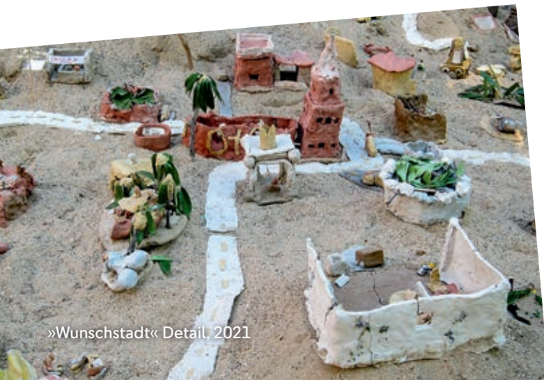
»Wunschstadt« Detail, 2021