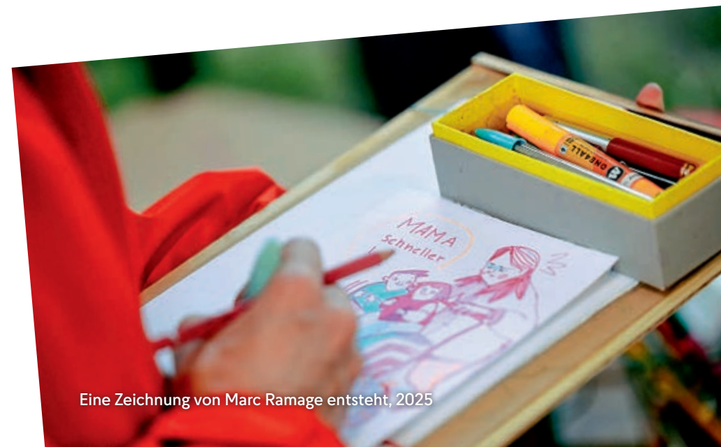
Eine Zeichnung von Marc Ramage entsteht, 2025

Auch hier gilt: Wenn du schon bei dem ersten Kurs teilgenommen hast, kannst du in diesem einfach weitermachen oder eine weitere Figur erfinden bis zu einem ganzen Comic-Universum! Neueinstieg ist genauso gut möglich.