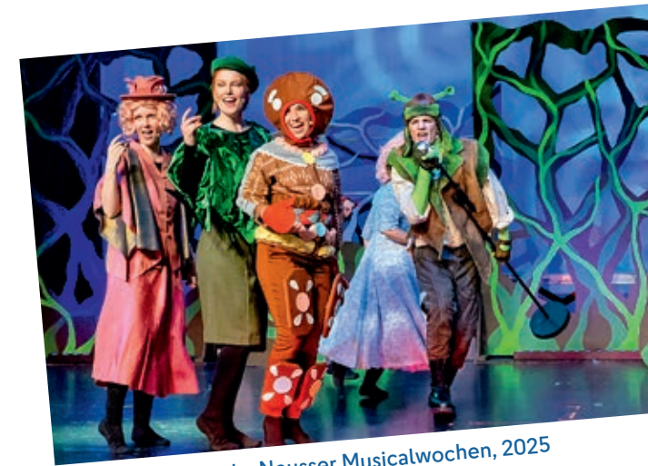
»Shrek das Musical«, Neusser Musicalwochen, 2025

Das 2016 gegründete Jugendensemble des Kulturforum Alten Post bietet 16 bis 23-jährigen Theaterbegeisterten einen ersten professionellen Einstieg in Bühnenprojekte. In einem mehrmonatigen Prozess wird eine Storyline gefunden, Figuren erarbeitet, geprobt und schließlich alles mit Bühnenbild, Licht und Kostüm in einen Theaterabend zusammengeführt. Die Teilnehmenden wachsen als Gruppe eng zusammen und individuell über sich hinaus. Im Sommersemester 2026 liegt die letzte Produktion gerade hinter uns, die nächste Runde wird erst im Wintersemester wieder starten, der Castingtermin wird auf unserer Homepage rechtzeitig bekannt gegeben!