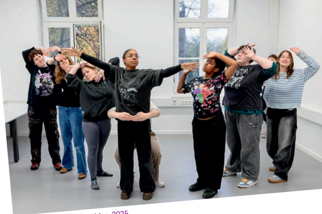
Probe des Jugendensembles, 2025

Wenn du Interesse daran hast, deine eigenen Themen künstlerisch zu erforschen, bekommst du hier Zeit und die nötigen Mittel, um dich einer Kunstform zu widmen, die zwischen bildender und darstellender Kunst steht.