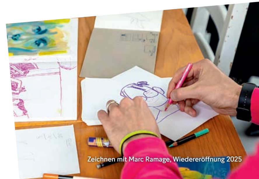
Zeichnen mit Marc Ramage, Wiedereröffnung 2025

Dies ist die Fortführung des oben stehenden Kurses. Neueinsteiger*innen sind herzlich willkommen.