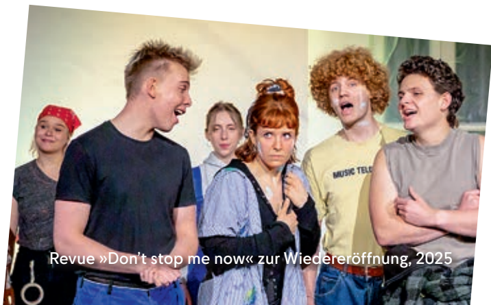
Revue »Don't stop me now« zur Wiedereröffnung, 2025

Dies ist ein Schauspielkurs für Jugendliche. Aber auch ein Experiment: denn hier bist du gefragt, die Welt aus verschiedenen Blickwinkeln zu sehen. Jede Geschichte hat mehrere Seiten und jede Figur ihre eigene Wahrheit! Anhand von Schreibübungen und Improvisation entwickeln wir eigene Szenen, in denen sich Konflikte, Missverständnisse oder geheimnisvolle Ereignisse aus unterschiedlichen Perspektiven entfalten. Du schlüpfst in verschiedene Rollen, tauschst die Perspektive und gehst auf Spurensuche. Mit Neugierde und Spiellust finden wir heraus, wie unterschiedlich Geschichten verlaufen können – je nachdem, wer sie erzählt und wie sie wahrgenommen werden. Am Ende stellt sich das Publikum die spannende Frage: Was ist hier wirklich passiert?