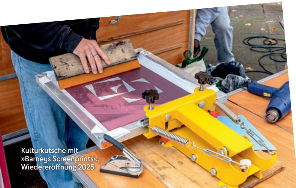
Kulturkutsche mit »Barneys Screenprints«, Wiedereröffnung 2025

Kosten: nach Zeit- und Materialaufwand in Absprache.