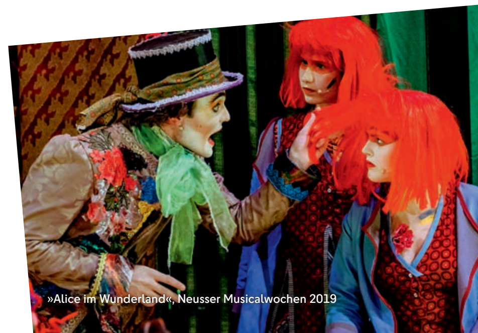
»Alice im Wunderland«, Neusser Musicalwochen 2019